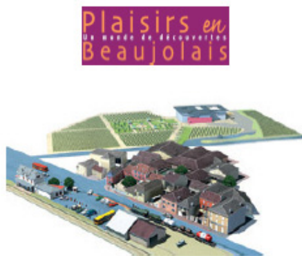
Le parc de la vigne

18h00 : Dégustation des crus de MORGON au Caveau du Château de Fontcrenne à Villé-Morgon (69)