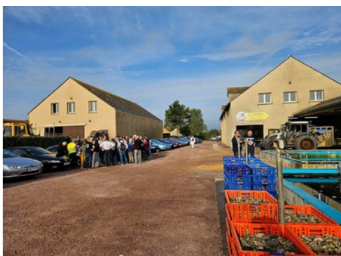
Nouvelle concession Peugeot ?

Après remplissage de la cour de l'ostréiculteur avec nos coupés, nous sommes reçus par une dame charmante, passionnée par son métier; qui nous explique très pédagogiquement tout ce qu'il faut savoir sur ce coquillage. Des questions lui sont posées, elle nous répond avec professionnalisme. Toutes les étapes de production nous sont décrites. Elle nous fait visiter l'atelier de conditionnement et d'expédition et nous emmène presque charger le camion qui attend: Super !