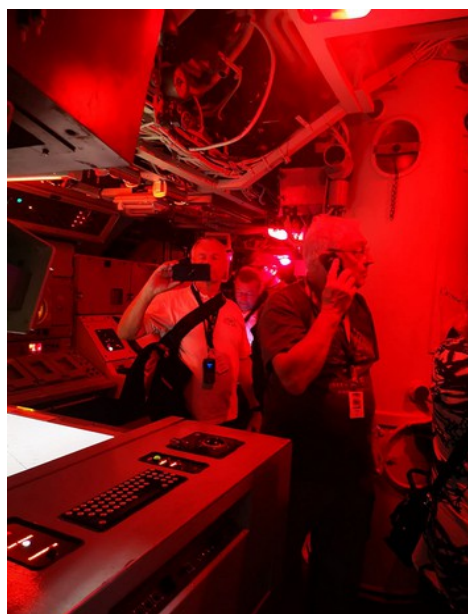
Poste de commandement

Avant cette visite, je n'avais aucune idée d'un tel confinement.