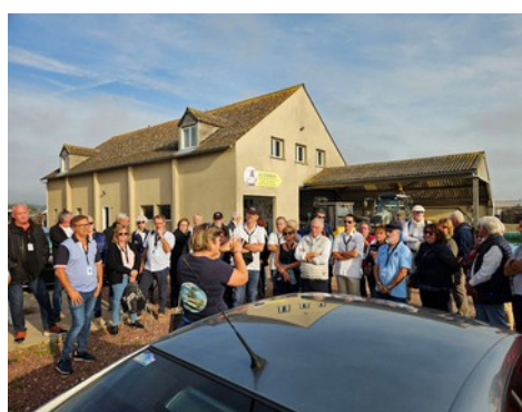
Une passionnée d'ostréiculture

Par la suite, nous sommes invités à regagner une salle de dégustation où nous allons nous régaler. Des huîtres fraîchement sorties des parcs avec un petit vin parfait pour l'accompagnement. Particularité, essayez le poivre à la place du citron: Pourquoi pas ! Le tout avec une présentation vidéo consacrée à l'huître: De sa naissance à sa consommation. Nous apprenons ainsi que toutes les huîtres de France naissent dans 2 endroits seulement: Le Bassin d'Arcachon et le Bassin de Marennes – Oléron. La raison ? La température de l'eau, trop fraîche au Nord de la Charente. Pas chauvin, mais vive la Nouvelle Aquitaine !!