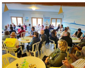
L'histoire de l'huître