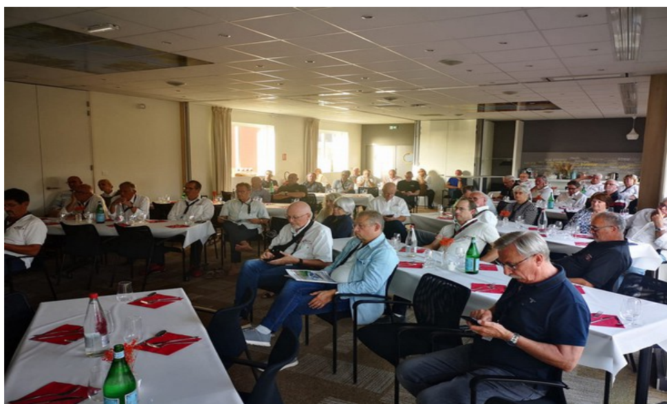
Les membres du Club

Après la fin des délibérations et des votes,